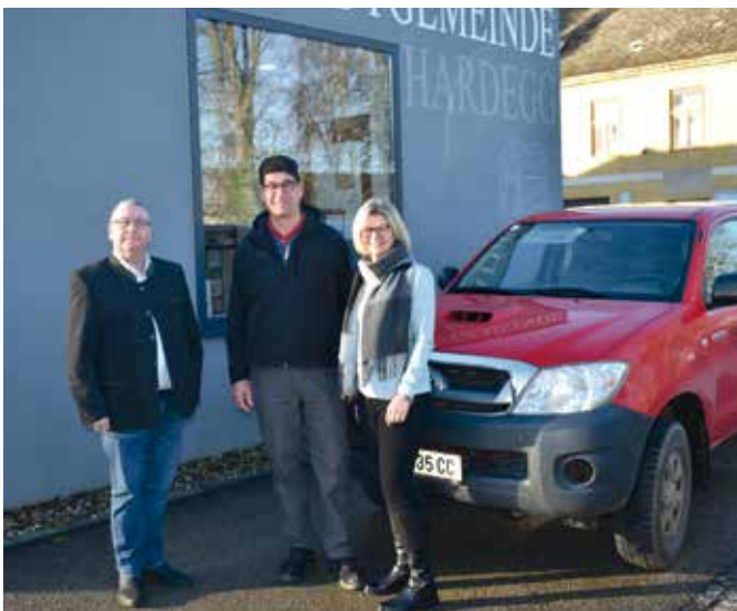
Hardegger Stadtnachrichten 4/2025

Wir wünschen ihm alles Gute für seine vielfältigen Aufgaben und begrüßen ihn recht herzlich in unserem Gemeinde-Team!