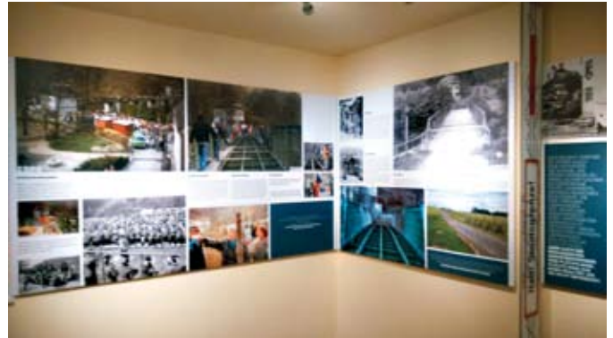
Eine der vielen Stationen: die Ausstellung im alten Zollhaus

Für dieses einmalige Erlebnis möchten wir unseren Gemeindegürgern die Möglichkeit geben, den Themenweg mit beiliegendem Gutschein heuer kostenlos zu besuchen.